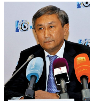
«Өзенмұнайгаз» АҚ еңбек ұжымы